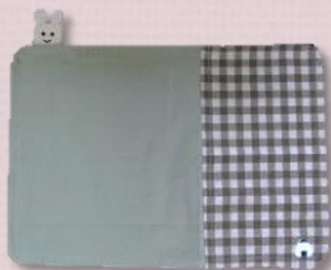
ランチョンマット ￥ 600 (縦 300 mm×横 400 mm)