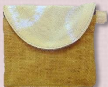
ちよこっとコインケース